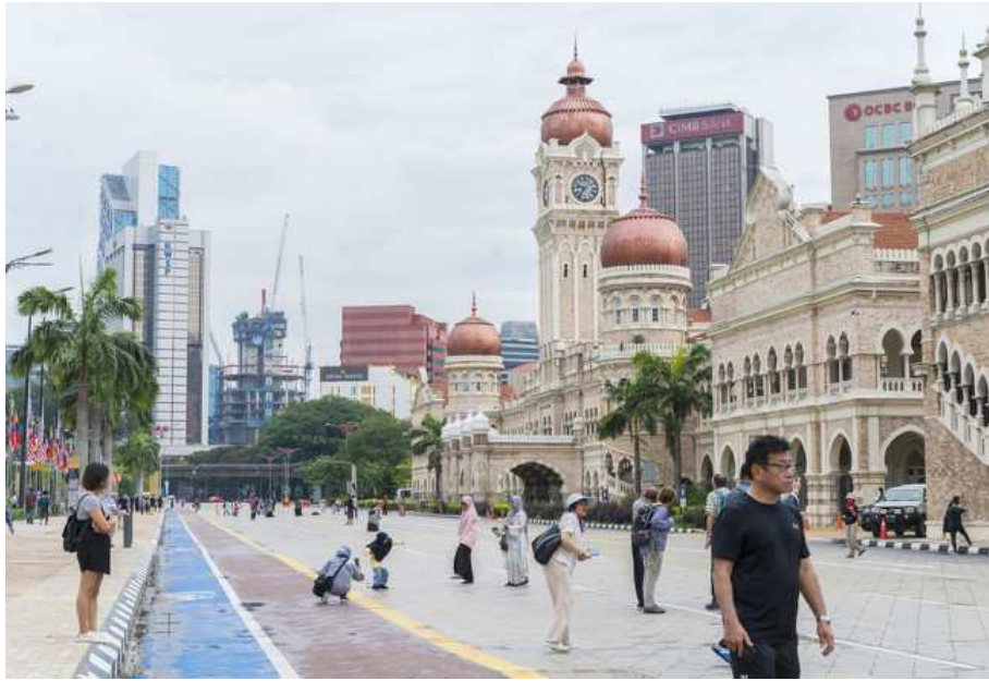
Edificio del Sultán Abdul Samad, Kuala Lumpur

Llegamos después al templo Thean Hou , al Palacio Real y al monumento nacional de Lake Gardens , no sin pasar antes por las preciosas zonas verdes que, sin duda, sorprenden en Kuala Lumpur.